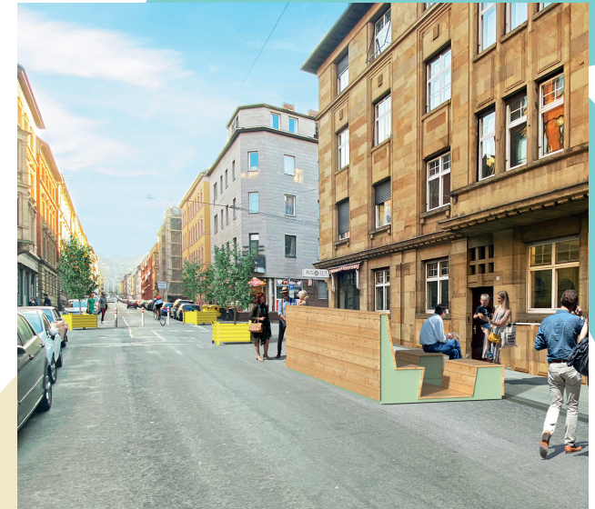
Visualisierung des zukünftigen Superblocks Augustenstraße. 1