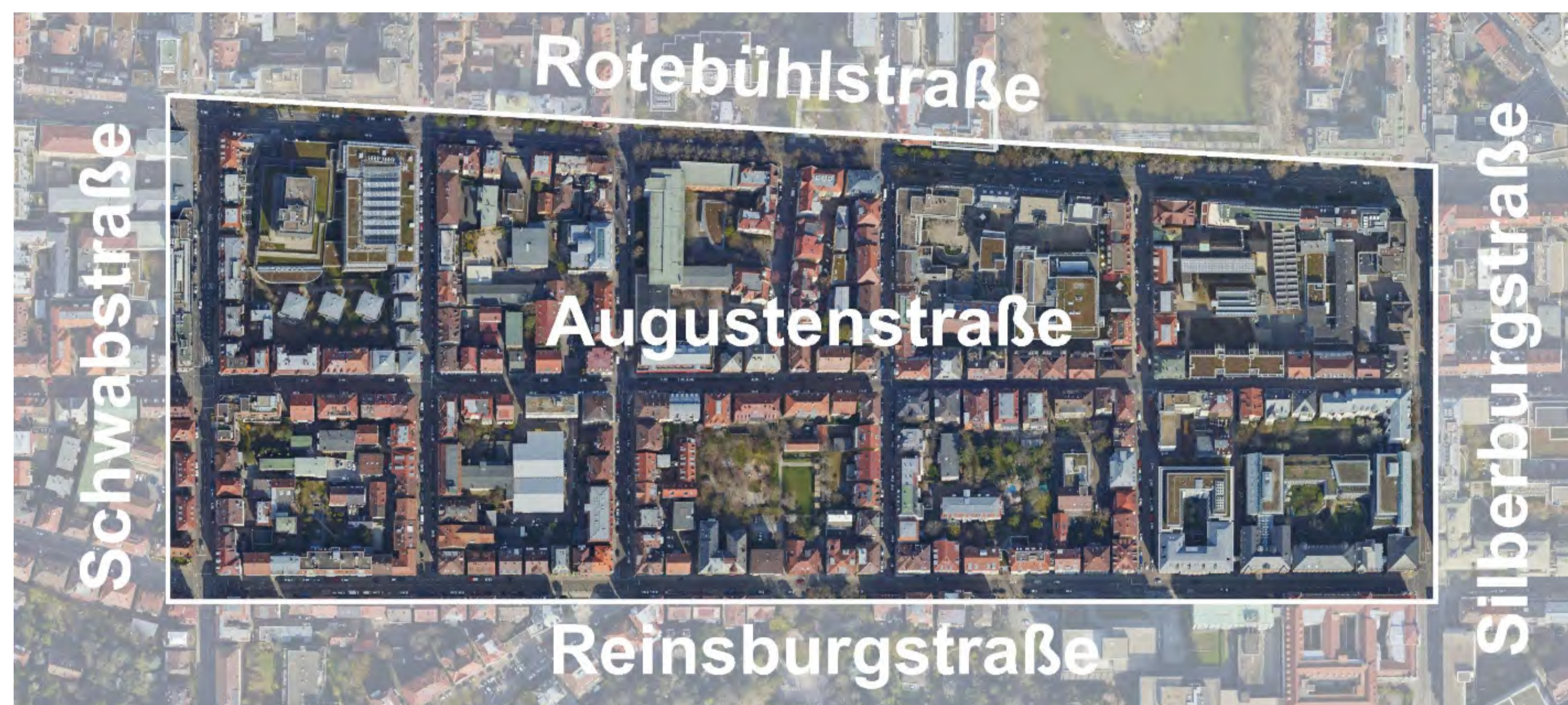
Lageplan Projektgebiet