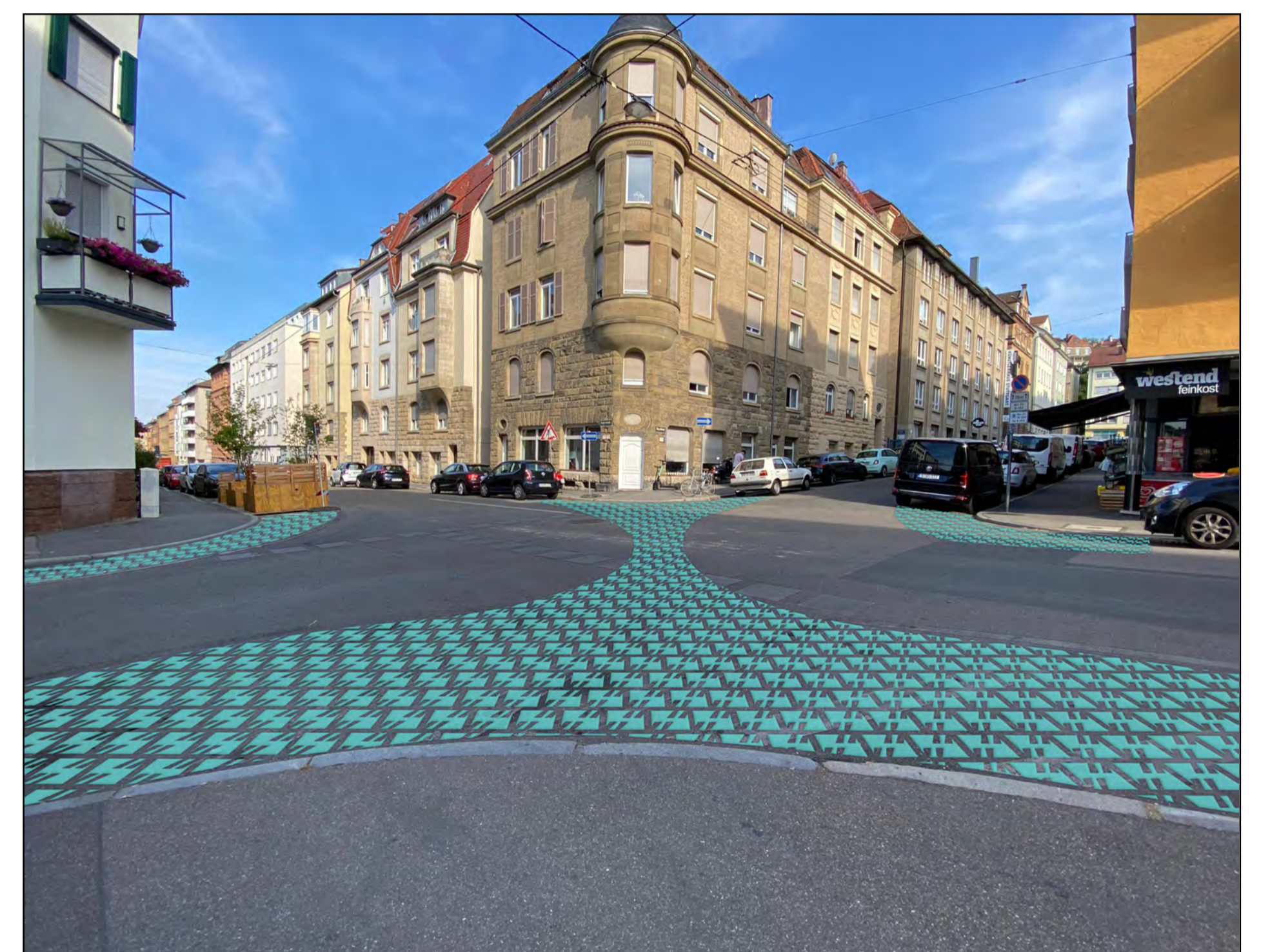
Kreuzung mit beispielhafter Bodenmarkierung

Kern dieses Konzepts ist es, die Durchfahrt innerhalb des Superblocks durch die Einrichtung von Diagonalsperren an allen Kreuzungen innerhalb des Superblocks zu unterbinden. Der Durchfahrtsverkehr wird auf das den Superblock umgebende Hauptverkehrsstraßennetz umgeleitet. Innerhalb des Superblocks entstehen in Einbahnverkehr befahrbare Erschließungsschleifen, womit weiterhin alle Gebäude angefahren werden können. Die freiwerdenden Verkehrsflächen können zum Aufenthalt, mit Pflanzkübeln oder Begrünung gestaltet oder zum Abstellen von Fahrrädern, E-Scooter oder anderen Zweirädern genutzt werden.