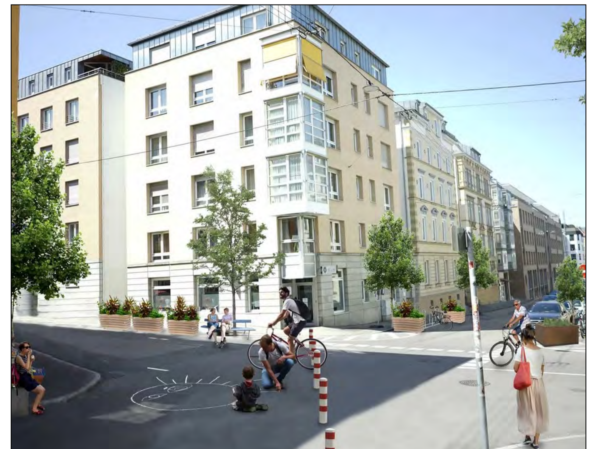
Straßenbereich nachher