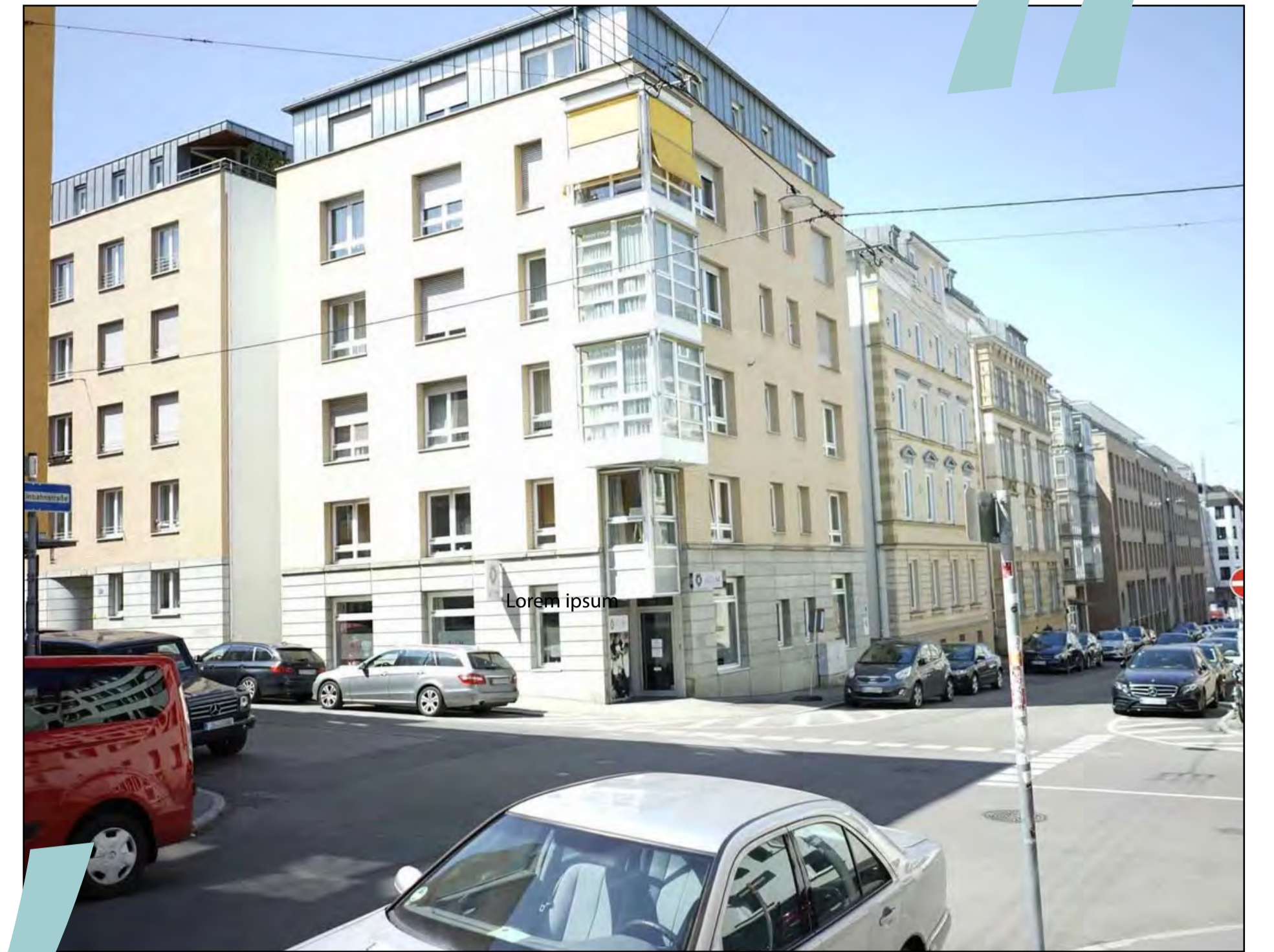
Straßenbereich vorher

Das Projektgebiet liegt im Südosten des Stuttgarter Westens und umfasst die Augustenstraße im Abschnitt zwischen der Schwab- und der Silberburgstraße sowie allen dazwischenliegenden Querstraßen: Reuchlin-, Hasenberg-, Knosp-, Senefelder- und Hermannstraße.