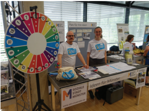
Teilnahme an S'läuft am 19. Mai 2019