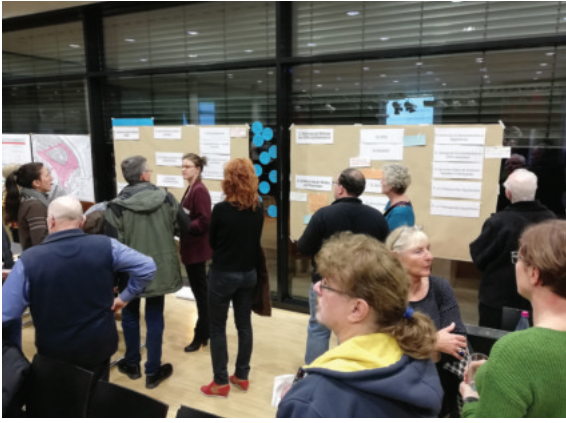
Austausch an der Themenwand bei der Auftaktveranstaltung am 10. Dezember 2018.