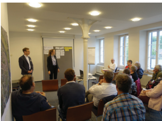
Themenabende von April bis Mai 2019