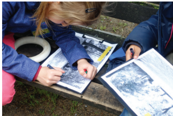
Schülerinnen- und Schülerbeteiligung an der Grünfläche Alter Friedhof von Mai bis Juni 2019