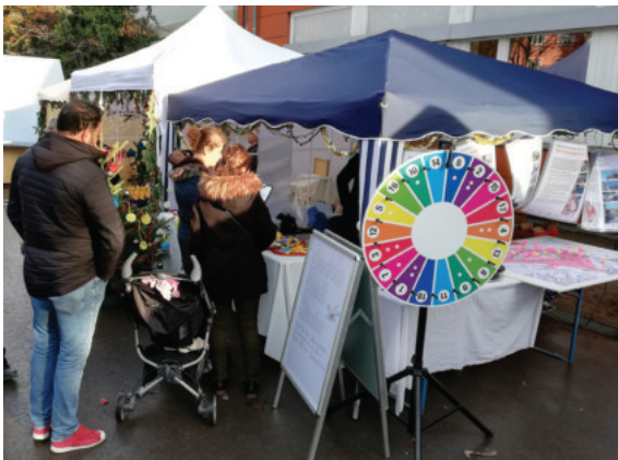
Weihnachtsmarkt am 01. Dezember 2018