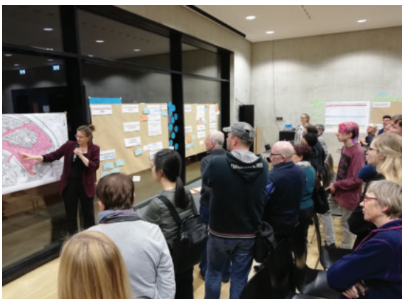
Auftaktveranstaltung am 10. Dezember 2018