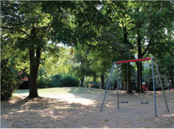
Die Grünfläche Alter Friedhof in der Enzstraße in Stuttgart-Münster

"Cookin'Roll", Entwicklung von Projekten