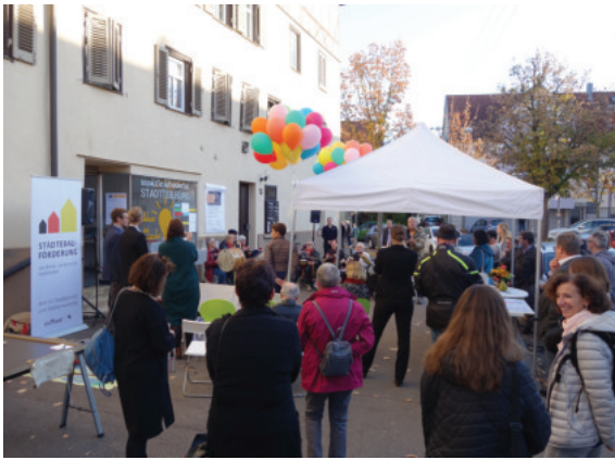
Eröffnung des Stadtteilbüros am 07. November 2018