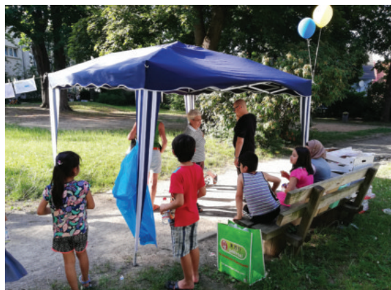
Beteiligung zur Umgestaltung der Grünfläche Alter Friedhof am 26. Juni 2019