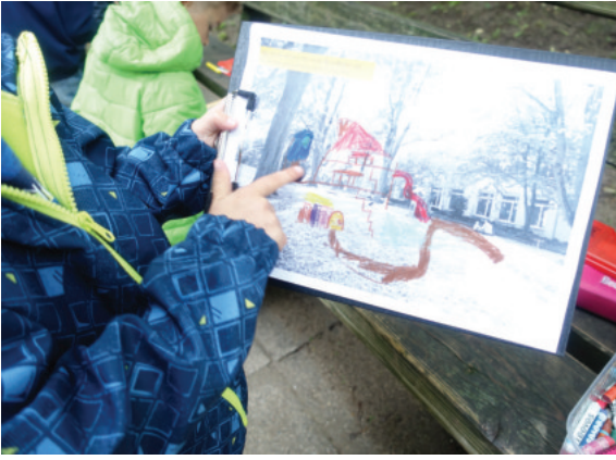
Beteiligung von Schülerinnen und Schülern der Elise-von-König-Gemeinschaftsschule auf der Grünfläche Alter Friedhof (Enzstraße)

es darum, Versorgungseinrichtungen zu erhalten und möglichst zu bündeln, um die Erreichbarkeit von unterschiedlichen Orten im Stadtbezirk zu ermöglichen. Die Ziele und Projektideen aus dem Integrierten Entwicklungskonzept wurden vorgestellt und ergänzt.