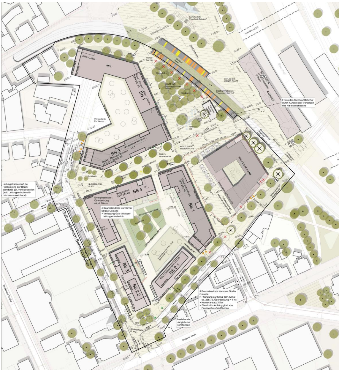
Abbildung 3: Freiflächengestaltungskonzept, faktorgruen 08.09.2017

len begrünten Platzfläche mit hoher Aufenthaltsqualität in direkter Anbindung an die bestehende Stadtbahnhaltestelle aus. Zusätzlich wird auf dem Platz eine neue Nutzung zum bestehenden Tiefbunker ermöglicht (ein Tiefbunkermuseum o. ä.). Auch die Ansiedlung publikumsintensiver Nutzungen in den Erdgeschosszonen entlang der Hauptachsen der neuen Baufelder dient der Belebung des Wiener Platzes. Durch die Aufweitung der Burgenlandstraße nach Osten wird auch die Einbindung des Gebäudes Wiener Platz 1 (ehemaliges Postgebäude) in den städtebaulichen Kontext erreicht. Zwei kleinere öffentliche Platzbereiche bilden von Süden und Westen her den Auftakt zum neuen Quartier (Ecke Dornbirner- und Kremser Straße und Ecke Dornbirner- und Burgenlandstraße).