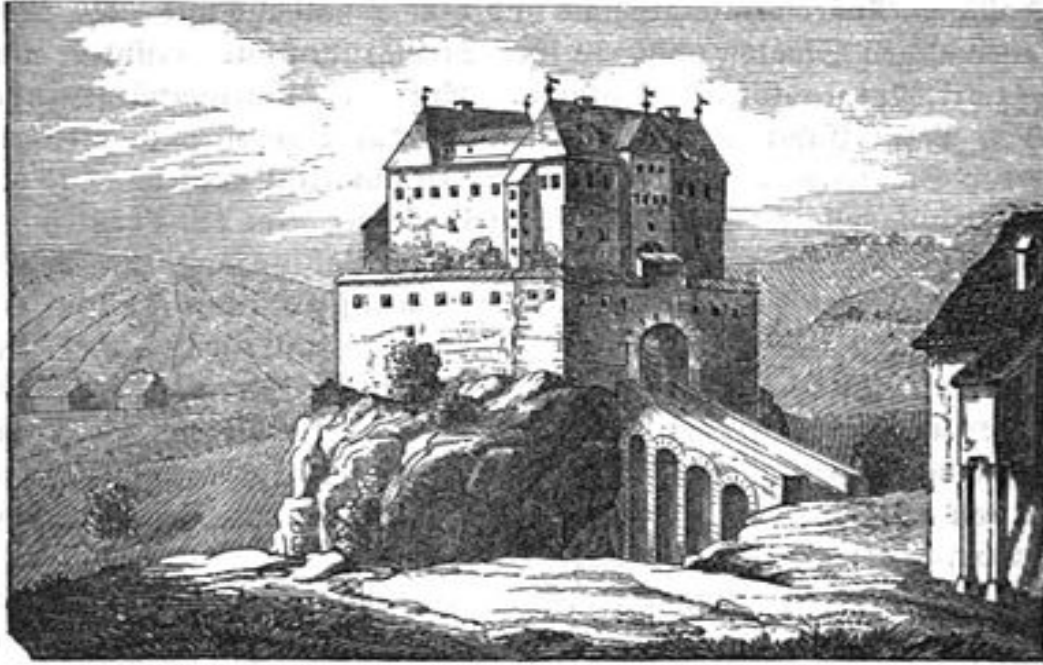
Ehemaliges Schloß Kaltenthal.

https://de.wikipedia.org/wiki/Burg_Kaltenthal#/media/Datei:OASTuttgartAmt_172b.jpg