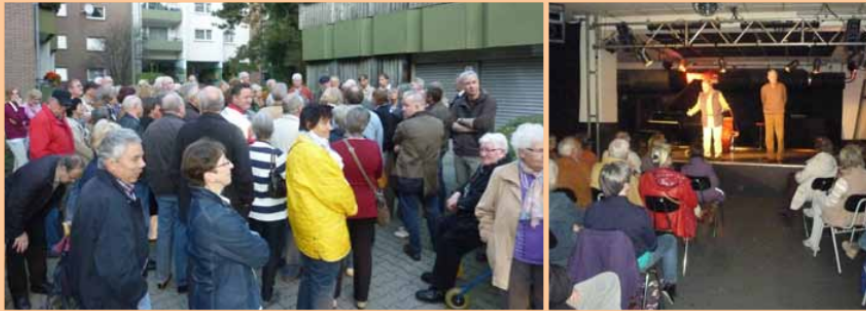
Im Herbst 2013 folgten rund 80 Personen der Einladung zum Spaziergang „Von der Pferdetränke bis zum Henkelmann“ und zum anschließenden geselligen Beisammensein im Henkelmann.