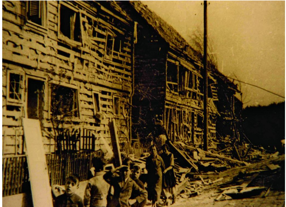
Schlossbergsiedlung in Kaltental nach Luftangriff der Alliierten am 11. März 1943