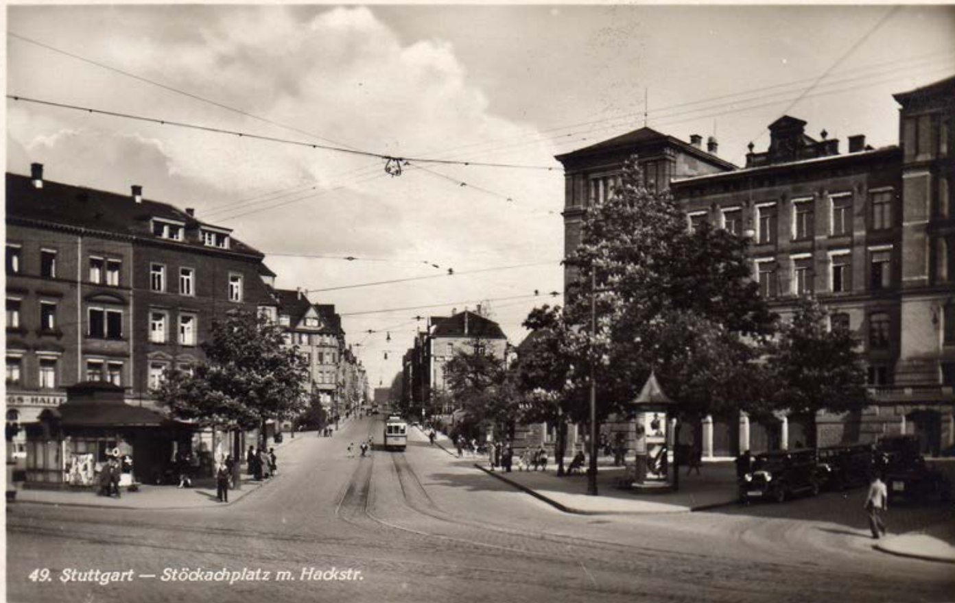
49. Stuttgart — Stöckachplatz m. Hackstr.