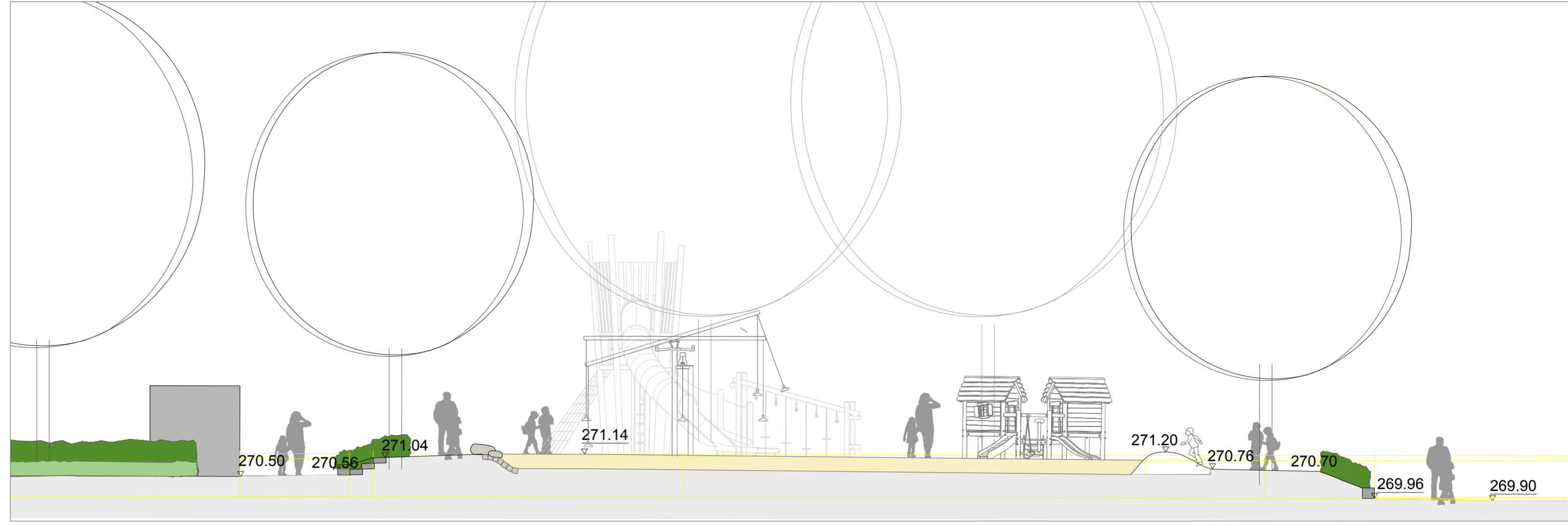
Spielplatz Schnittansicht 2-2 M 1:100