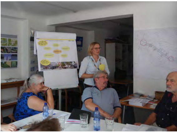
Planung der Mitglieder der PG Gablenberger Hauptstraße für das Kolloquium zum Wettbewerb

Der Gesamtraum Schule, die Spielplätze und das Karamba Basta am Schmalzmarkt dienen den Kindern und Jugendlichen als häufigster Aufenthaltsort im Stadtteil. Es fehlen demnach weitere Aufenthaltsorte und Freiräume. Das Thema Sport und Bewegung spielt laut der Befragung eine große Rolle für die Kinder und Jugendlichen – eine Mehrheit gibt an, gerne eine neue Sportart lernen zu wollen.