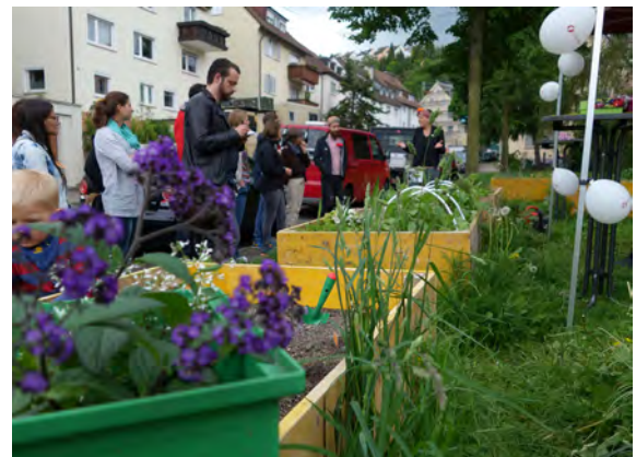
...und mit dem Pflanz- und Eröffnungspicknick am 20.05.2017 eingeweiht.