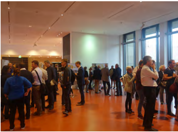
Die Vertreter der Planungsbüros informieren sich an den Stellwänden am Kolloquium zum Wettbewerb Gablenberger Hauptstraße

Seit der Gründung im März 2016 hat das Bürgergremium bislang sieben Mal getagt.