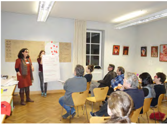
Die Sitzungen der in 2017 neu gegründeten Projektgruppe Kunst und Kultur (hier im Muse-o)