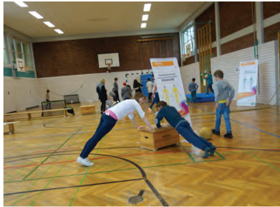
Leider Regen beim Bewegungstag "Gablenberg bewegt sich!" am 19.05.2017... dann wurde einfach in die Sporthalle ausgewichen.