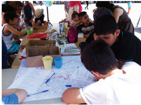
Befragungsaktion von Kindern und Jugendlichen auf dem Schulfest der Grund- und Werkrealschule Gablenberg, 09.07.2016