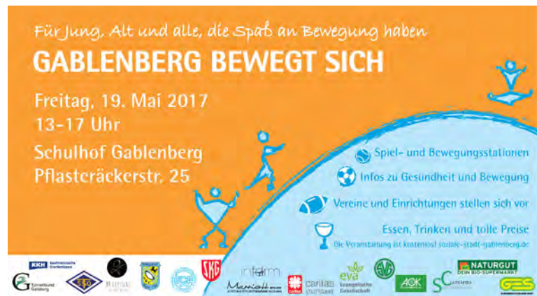
Flyer zum Bewegungstag am 19.05.2017

Das Ziel, Grünflächen mit Aufenthaltsqualität zu schaffen , wurde durch das Projekt "Urbanes Gärtnern Gablenberg" in der Bergstraße bereits angegangen (siehe unten). Die Idee der Aufwertung des Höhenwegs muss noch konkretisiert werden.