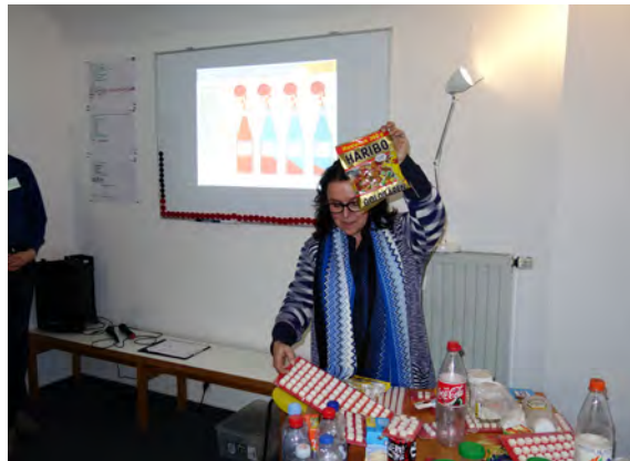
Viel Interesse und anschauliches Material beim Themennachmittag "Gesund älter werden in Gablenberg" am 09.02.2017