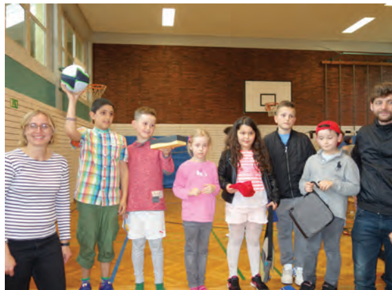
Preisverleihung beim Bewegungstag (l.) mit dem stolzen Siegern (r.)