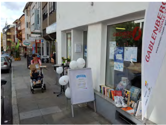
Teilnahme an den Hofflohmärkten Stuttgart Ost, 17.09.2016