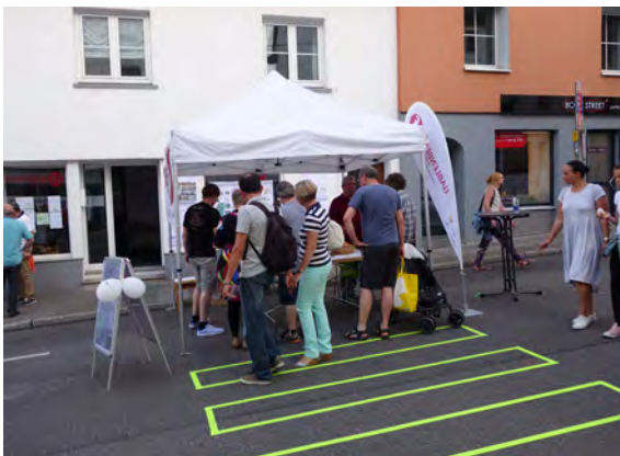
Teilnahme mit einem Informationsstand an der Längen Ost Nacht 2016 und 2017