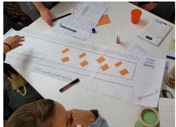
Projektgruppe Grün / Urbanes Gärtnern; erste Skizzen für die Anordnung der Hochbeete