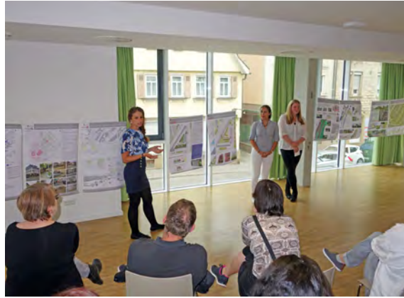
Präsentation von studentischen Entwürfen zur Freiraumgestaltung in Gablenberg, 12.07.2016