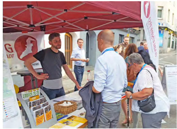
Beteiligung an der Langen Ost Nacht am 22.07.2017