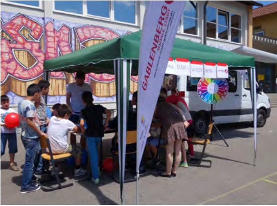
Rege Beteiligung bei der Befragungsaktion von Kindern und Jugendlichen auf dem Schulfest der GWRS Gablenberg

Inzwischen erscheint ebenfalls ein regelmäßiger Newsletter (ca. alle drei Monate), der über aktuelle Themen und Termine informiert.