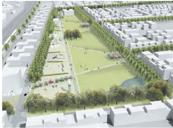
Konkrete Entwürfe zum Spielplatz Klingen-/Bergstraße und zur Klingenbachanlage