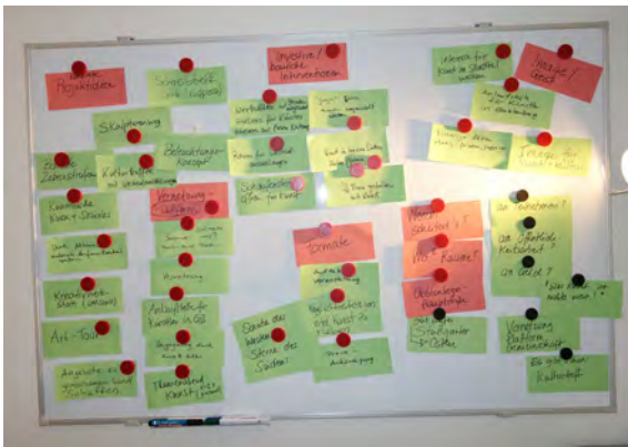
Erarbeitete Ergebnisse der PG Kunst und Kultur