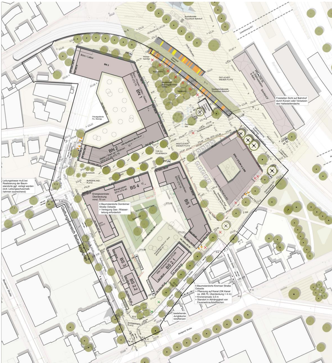
Abbildung 3: Freilächengestaltungskonzept, faktorgruen 08.09.2017

len begrünten Platzfläche mit hoher Aufenthaltsqualität in direkter Anbindung an die bestehende Stadtbahnhaltestelle aus. Zusätzlich wird auf dem Platz eine neue Nutzung zum bestehenden Tiefbunker ermöglicht (ein Tiefbunkermuseum o. ä.). Auch die Ansiedlung publikumsintensiver Nutzungen in den Erdgeschosszonen entlang der Hauptachsen der neuen Baufelder dient der Belebung des Wiener Platzes. Durch die Aufweitung der Burgenlandstraße nach Osten wird auch die Einbindung des Gebäudes Wiener Platz 1 (ehemaliges Postgebäude) in den städtebaulichen Kontext erreicht. Zwei kleinere öffentliche Platzbereiche bilden von Süden und Westen her den Auftakt zum neuen Quartier (Ecke Dornbirner- und Kremser Straße und Ecke Dornbirner- und Burgenlandstraße).