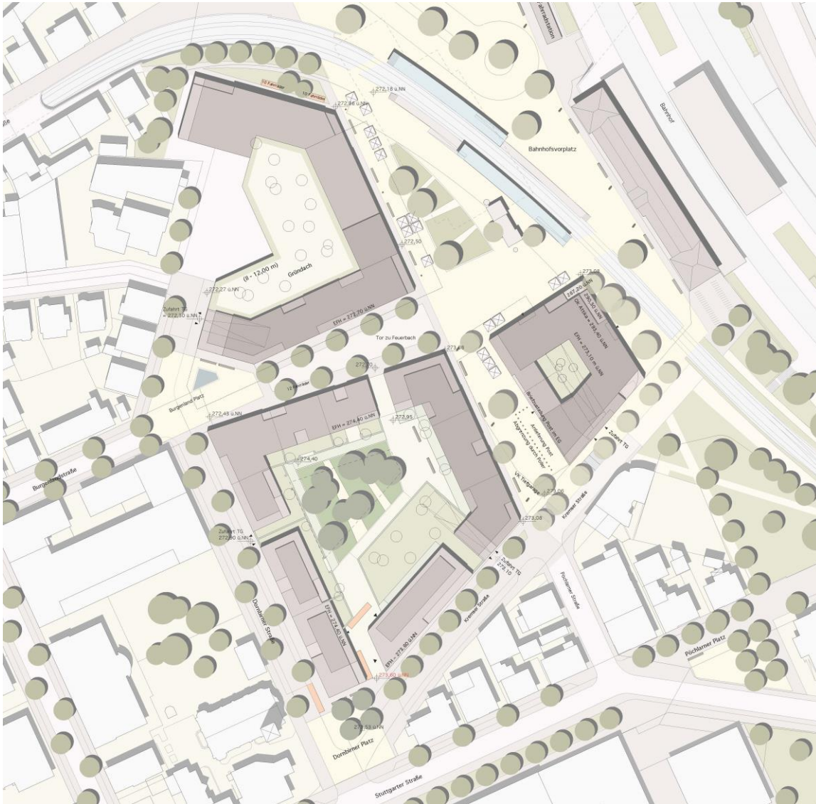
Abbildung 2: Weiterentwickelter Entwurf Architekturbüro Thomas Schüler, 01.09.2017

Im Mittelpunkt des Strukturwandels des östlichen Zentrums von Feuerbach steht die Umwandlung des ehemals überwiegend gewerblich genutzten Gebiets westlich des Feuerbacher Bahnhofs. Die Neustrukturierung hat zum Ziel, ein hochwertiges Mischgebiet mit verdichtetem, innerstädtischen Wohnen in zentraler, verkehrsgünstiger Lage für unterschiedliche Zielgruppen zu entwickeln. Dieses Ziel soll durch die planungsrechtliche Umsetzung des weiterentwickelten städtebaulichen Wettbewerbs (Architekturbüro Thomas Schüler, 2017) in Verbindung mit der überarbeiteten Freiraumgestaltung (Landschaftsarchitekten faktorgruen, 2017) erreicht werden. Die städtebauliche Konzeption fügt sich durch eine stringente, zum Wiener Platz hin ansteigende Blockrandbebauung (ca. 16 m bis ca. 22 m Höhe) in den städtebaulichen Kontext ein.