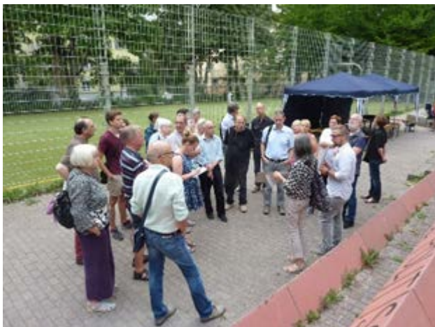
August 2018 Begehung Elisabethenanlage

Derzeit ist in der Villa Elisa ein Kindergarten untergebracht, der voraussichtlich im Mai 2018 ins Gesundheitsamt umziehen wird. Die Schwabschule hat Bedarf für die Außenflächen angemeldet, aber auch für Räume im Gebäude selbst. Bereits jetzt ist die Schule sehr beengt und wenn das Olga-Areal bewohnt ist, kommen noch mehr Kinder dazu. Sollte die Villa Elisa der Schwabschule zur weiteren Nutzung zur Verfügung gestellt werden, wird es eine förmliche Übergabe durch das Amt für Liegenschaften und Wohnen an das Schulverwaltungsamt geben. In Abstimmung mit der Konzeption der Schwabschule für den Ganztagesbetrieb wird dann ein Umbau- und Sanierungskonzept für die Villa erarbeitet.