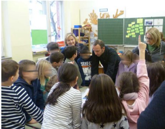
Kinderbeteiligung zu öffentlichen Flächen