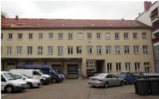
Ansicht Bauteil Adler Straße

Büros, Lagerflächen, Telekommunikationseinrichtungen, Post Sanierungsbedürftige Bausubstanz