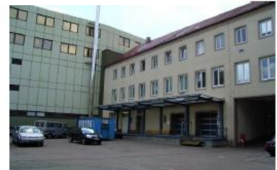
Ansicht Übergang Bauteil Adlerstraße zu Bauteil Böblinger Straße