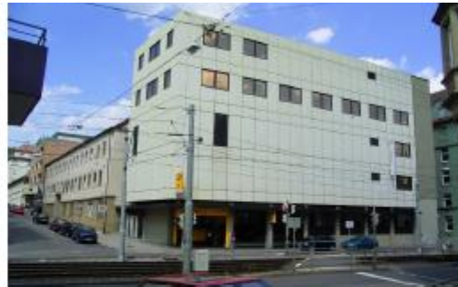
Ansicht Bauteil Böblinger Straße