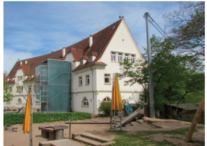
Das Umfeld der Schule soll aufgewertet werden