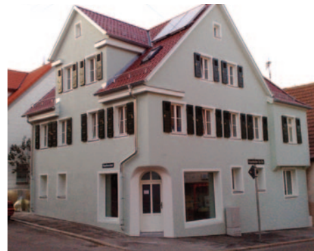
Ein Beispiel (vorher- nachher) für eine gelungene Modernisierung