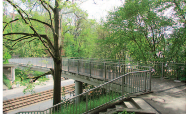
Die Fußwegeverbindungen sollen verbessert werden