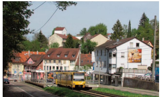
Die Ortsmitte soll schöner werden

Das Sanierungsgebiet erstreckt sich entlang der Böblinger Straße von der Polizeisiedlung im Norden bis zur Auffahrt Richtung Vaihingen im Süden. Auf dem katholischen Berg reicht es bis zur Engelboldstraße, auf dem evangelischen Berg bilden Schliffkopf- und Fuchswaldstraße die westliche Begrenzung. Hinzu kommt der Grünbereich um den Spielplatz in der Freudenstädter Straße. Die Karte in der Mitte dieser Broschüre zeigt das Sanierungsgebiet.