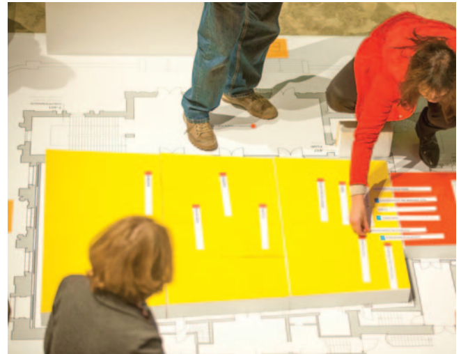
Bürgerbeteiligung am Nutzungskonzept für die Villa Berg

www.stoekach29.de/newsletter-archiv.html