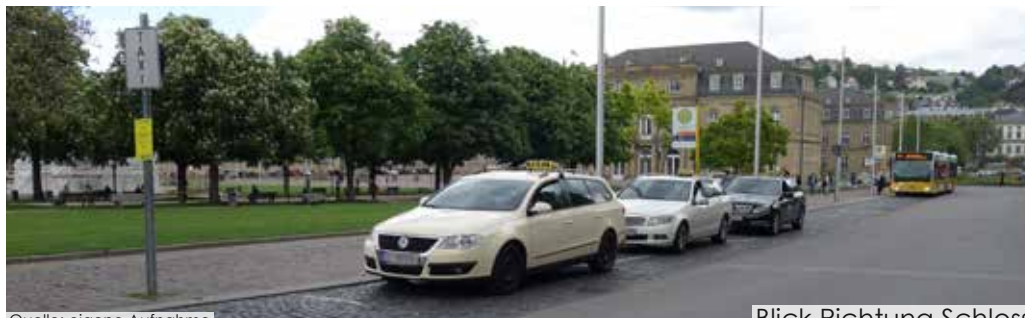
Blick Richtung Schloss