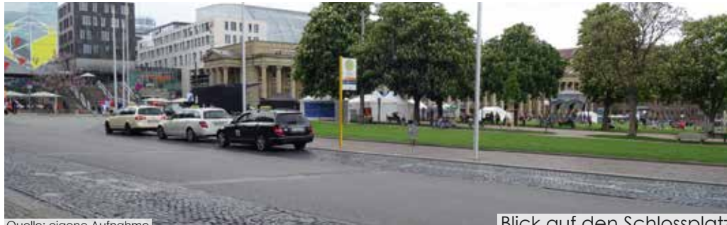
Blick auf den Schlossplatz