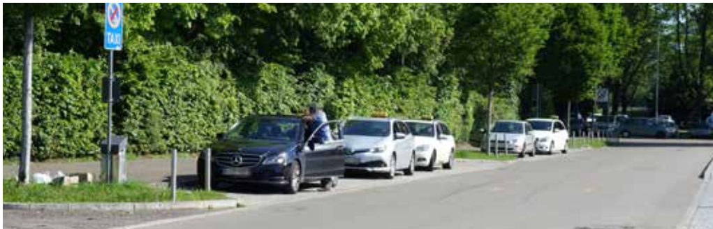
Blick entlang der Mercedes-Jellinek-Straße