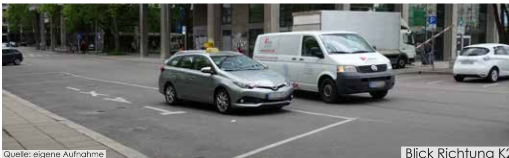
Blick Richtung K2