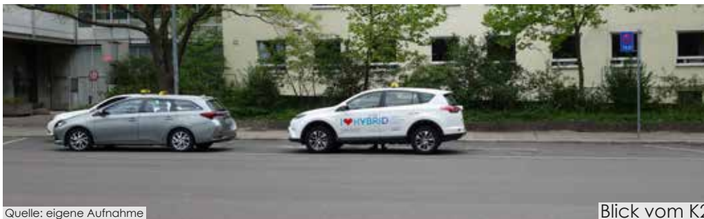
Blick vom K2