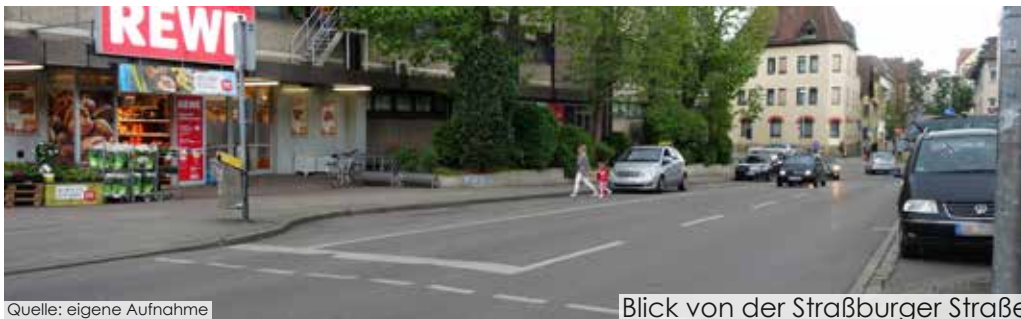
Blick von der Straßburger Straße