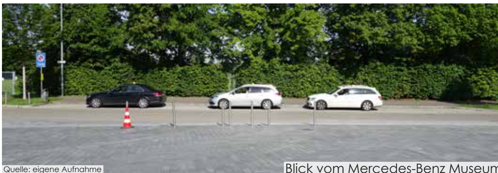
Blick vom Mercedes-Benz Museum