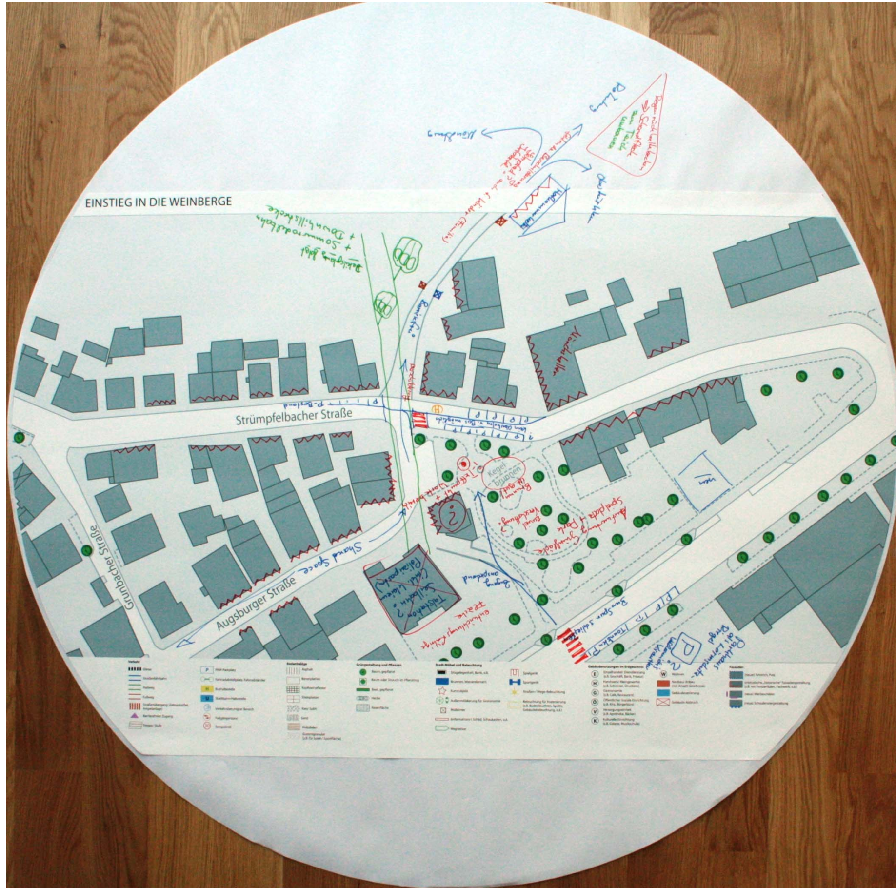
Detailplan zum Haupteinstieg in die Weinberge Nr.3