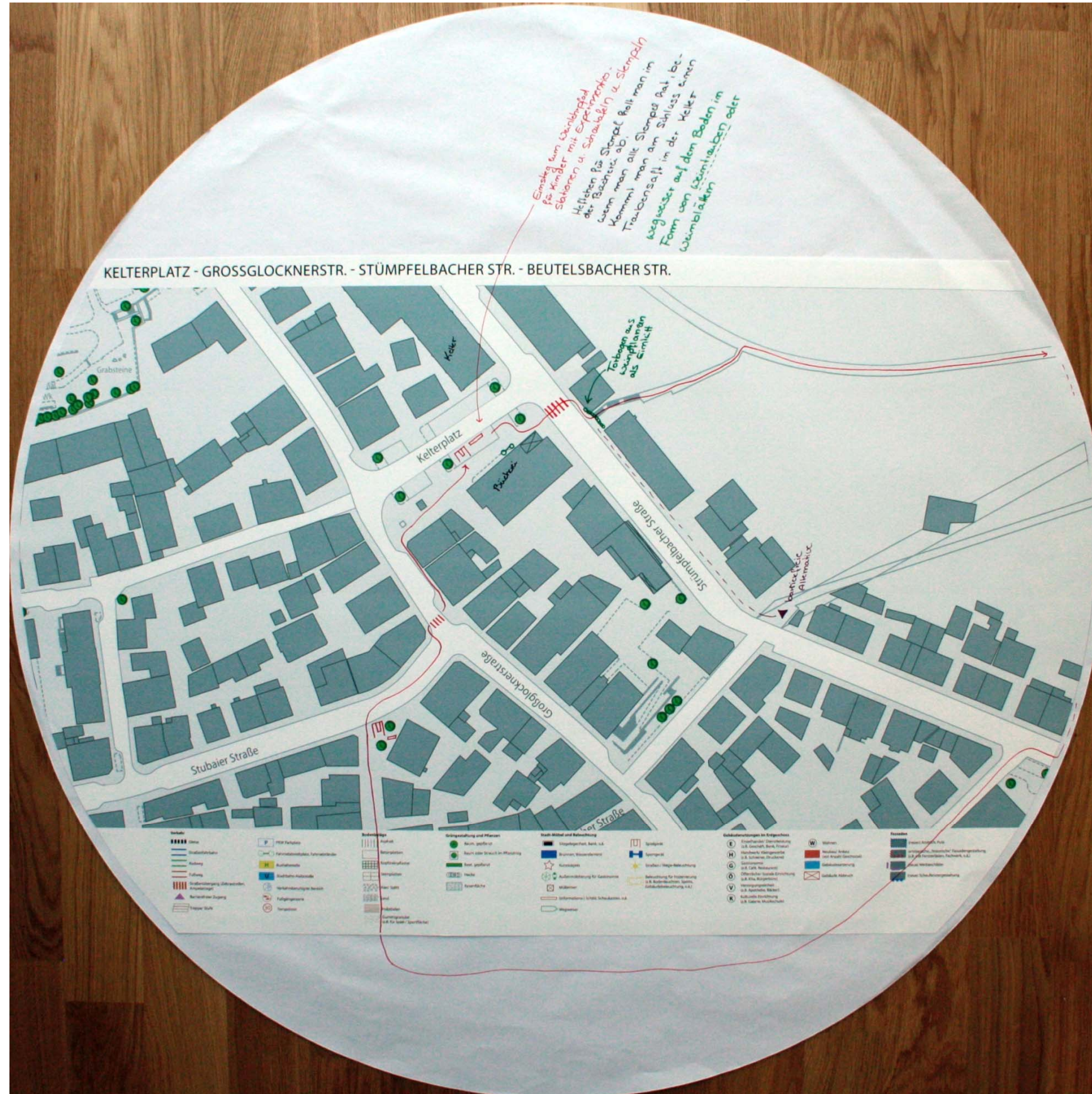
Detailplan zum Kelterplatz und der oberen Strümpfbacher Str. Nr. 1