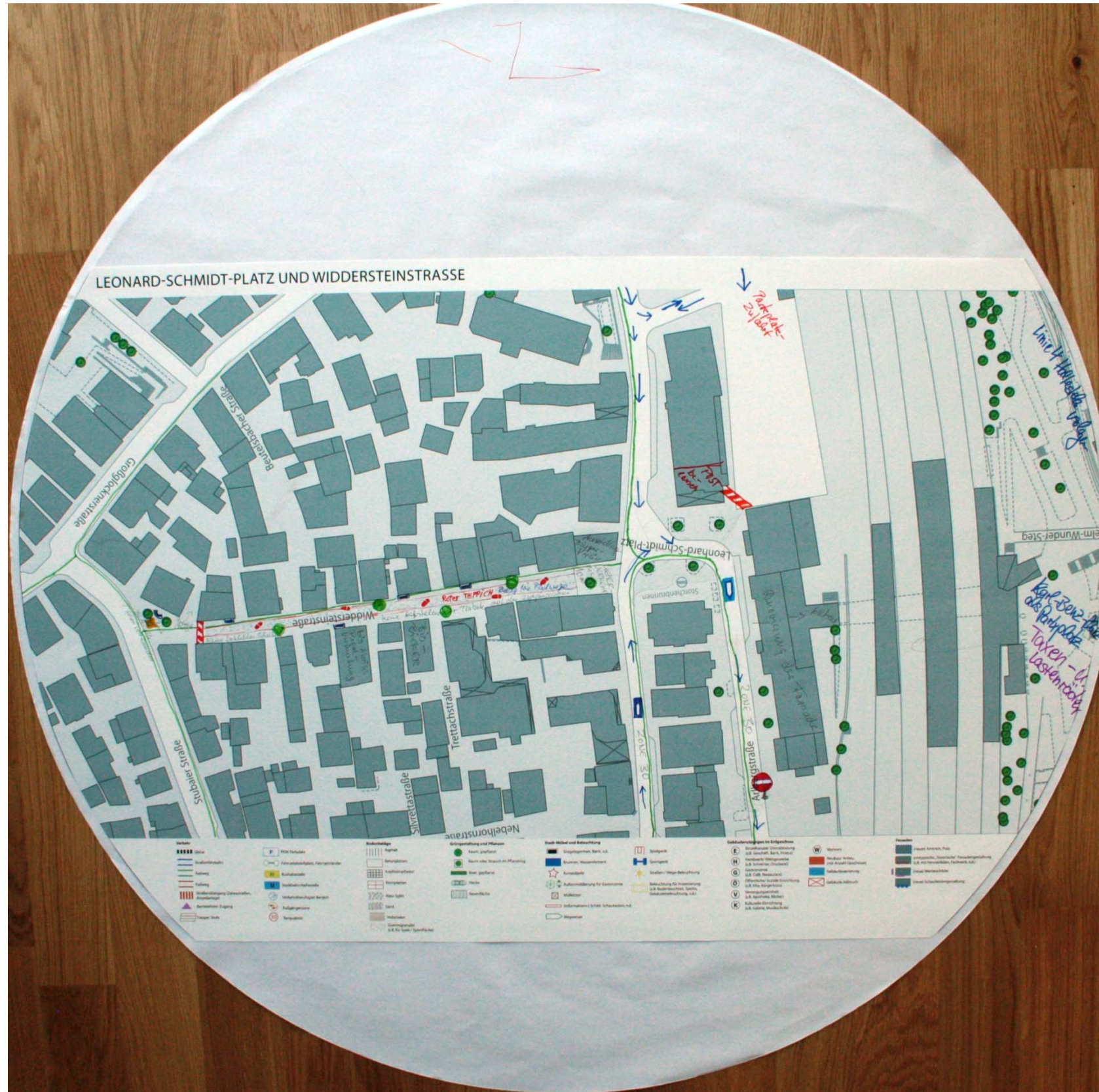
Detailplan zum Leonard-Schmidt-Platz Nr. 1