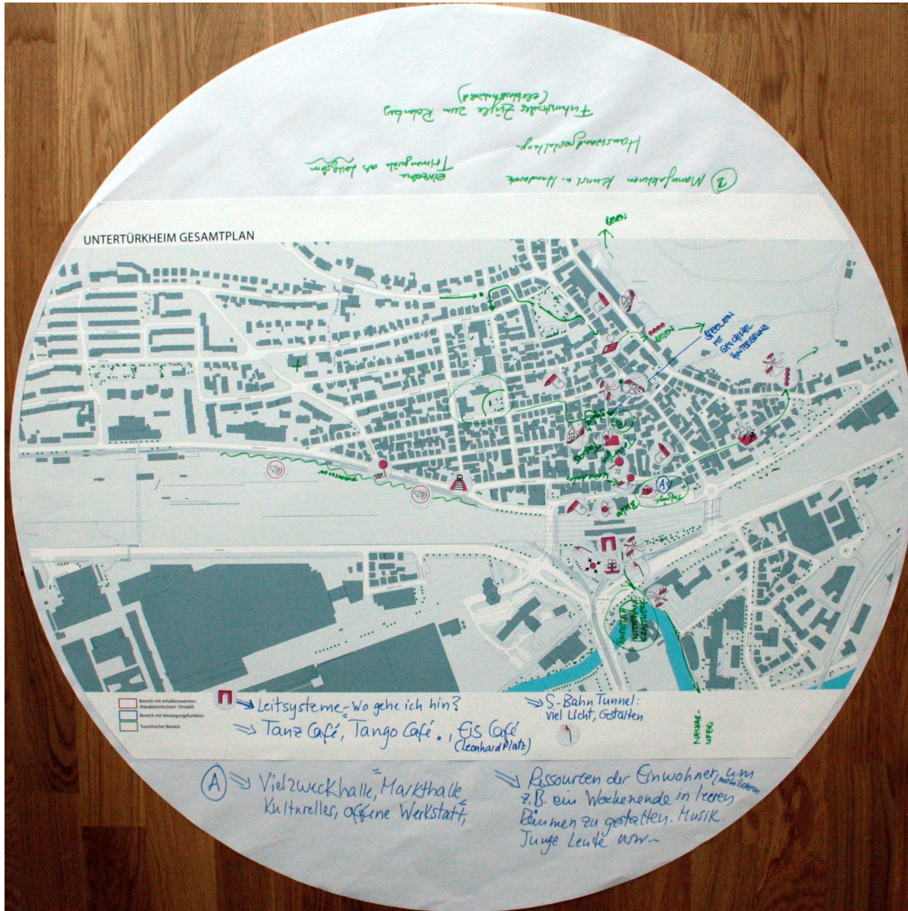
Bearbeiteter Rahmenplan Nr. 2