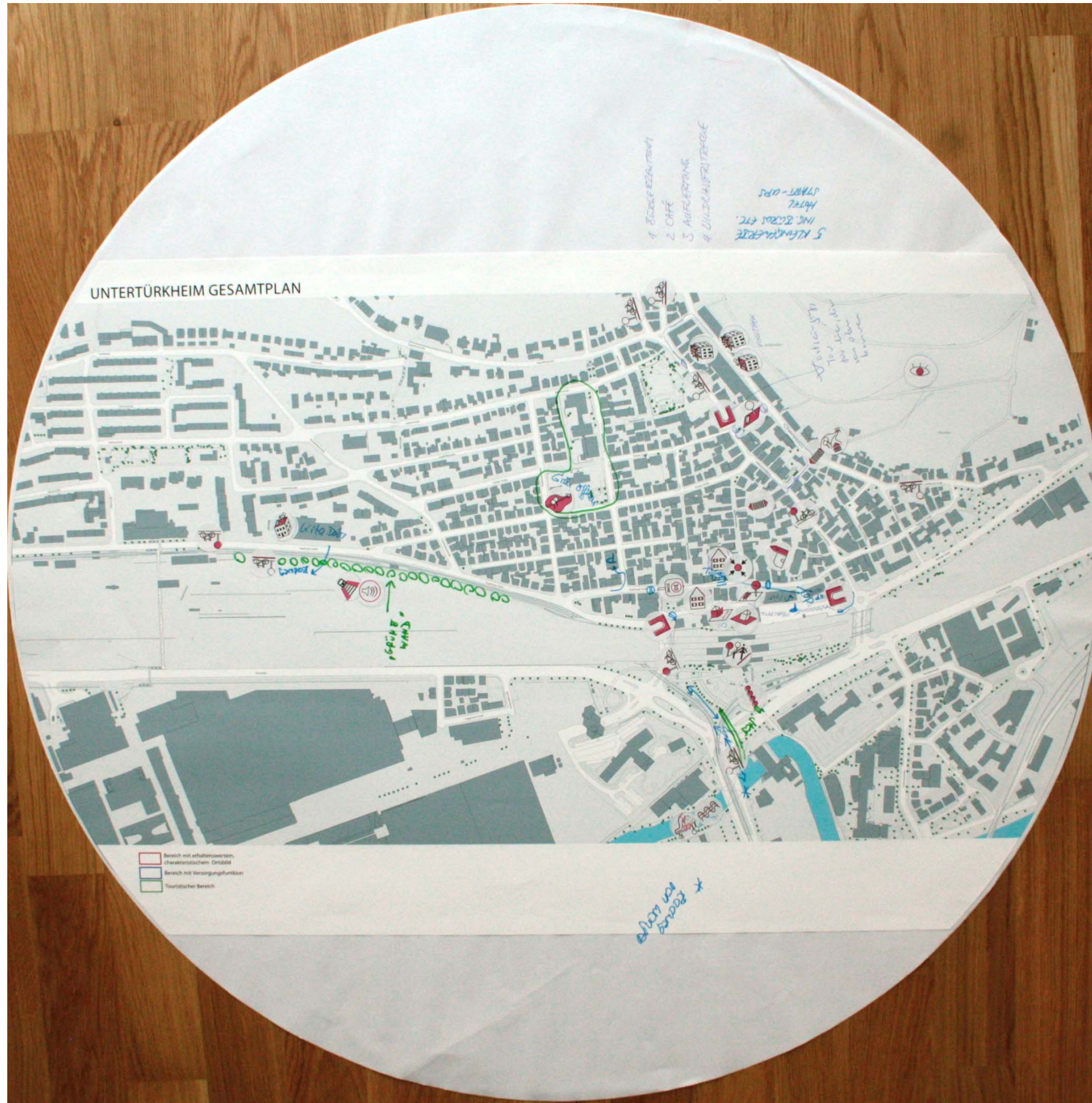
Bearbeiteter Rahmenplan Nr. 3