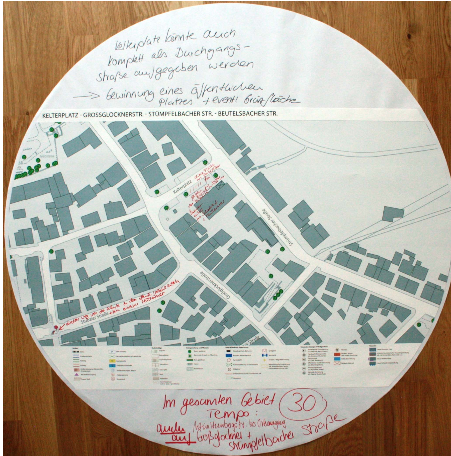
Detailplan zum Kelterplatz und der oberen Strümpfelbacher Str. Nr. 2