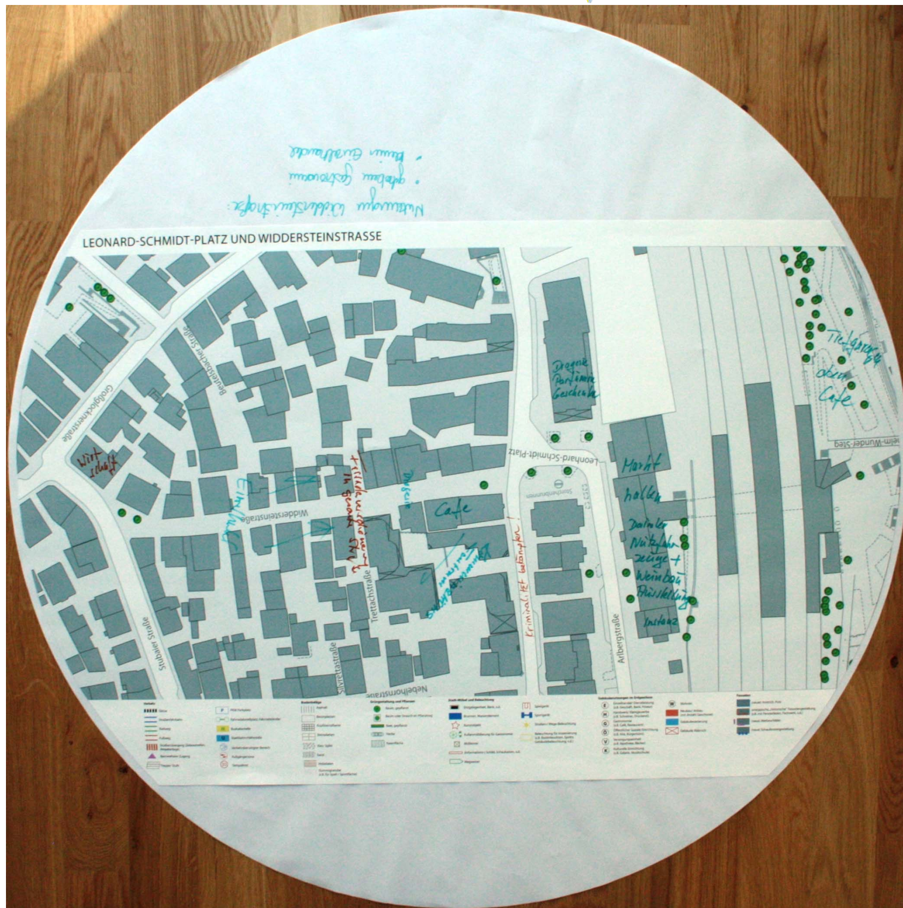
Detailplan zum Leonard-Schmidt-Platz Nr. 2