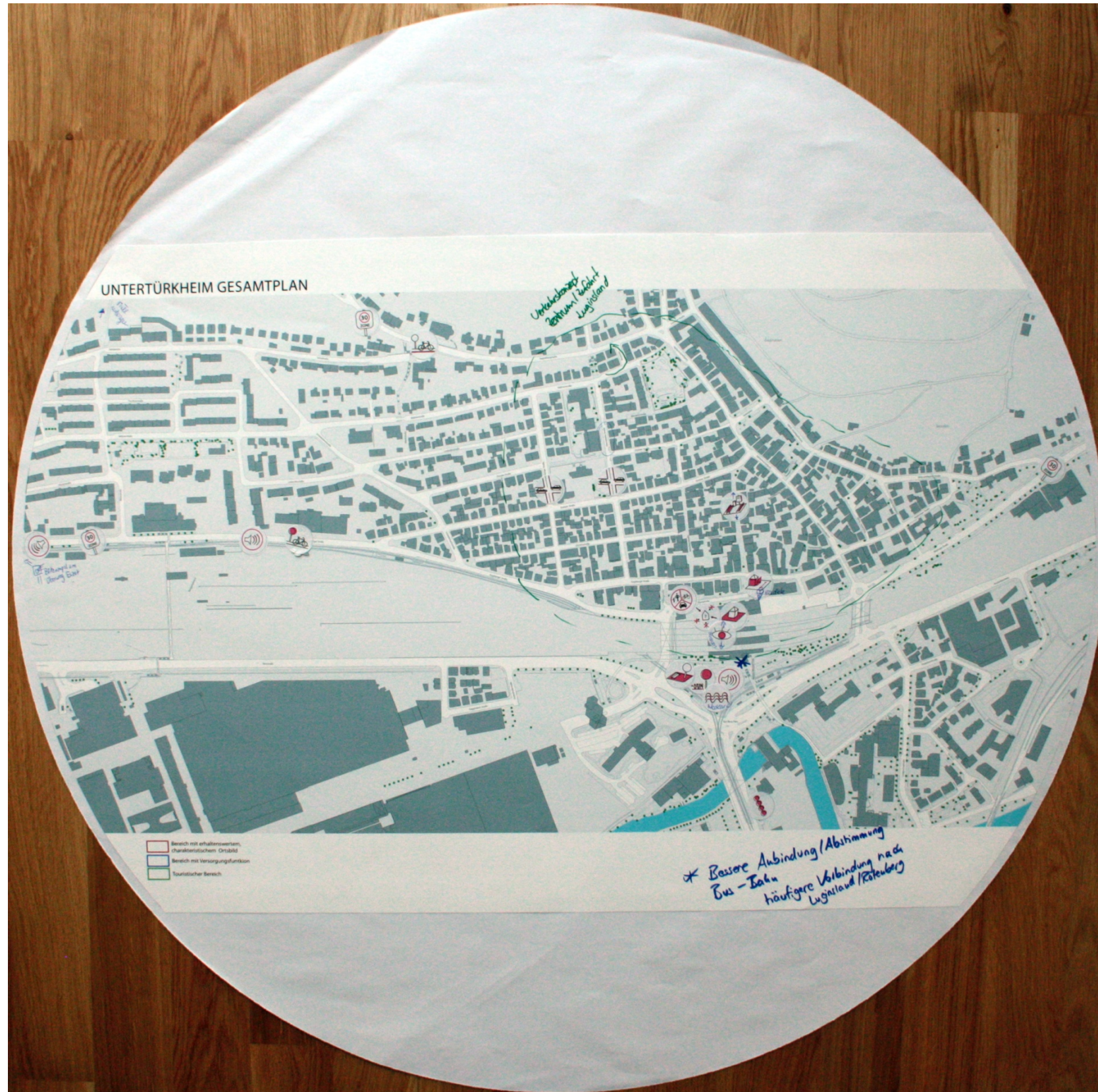
Bearbeiteter Rahmenplan Nr. 1