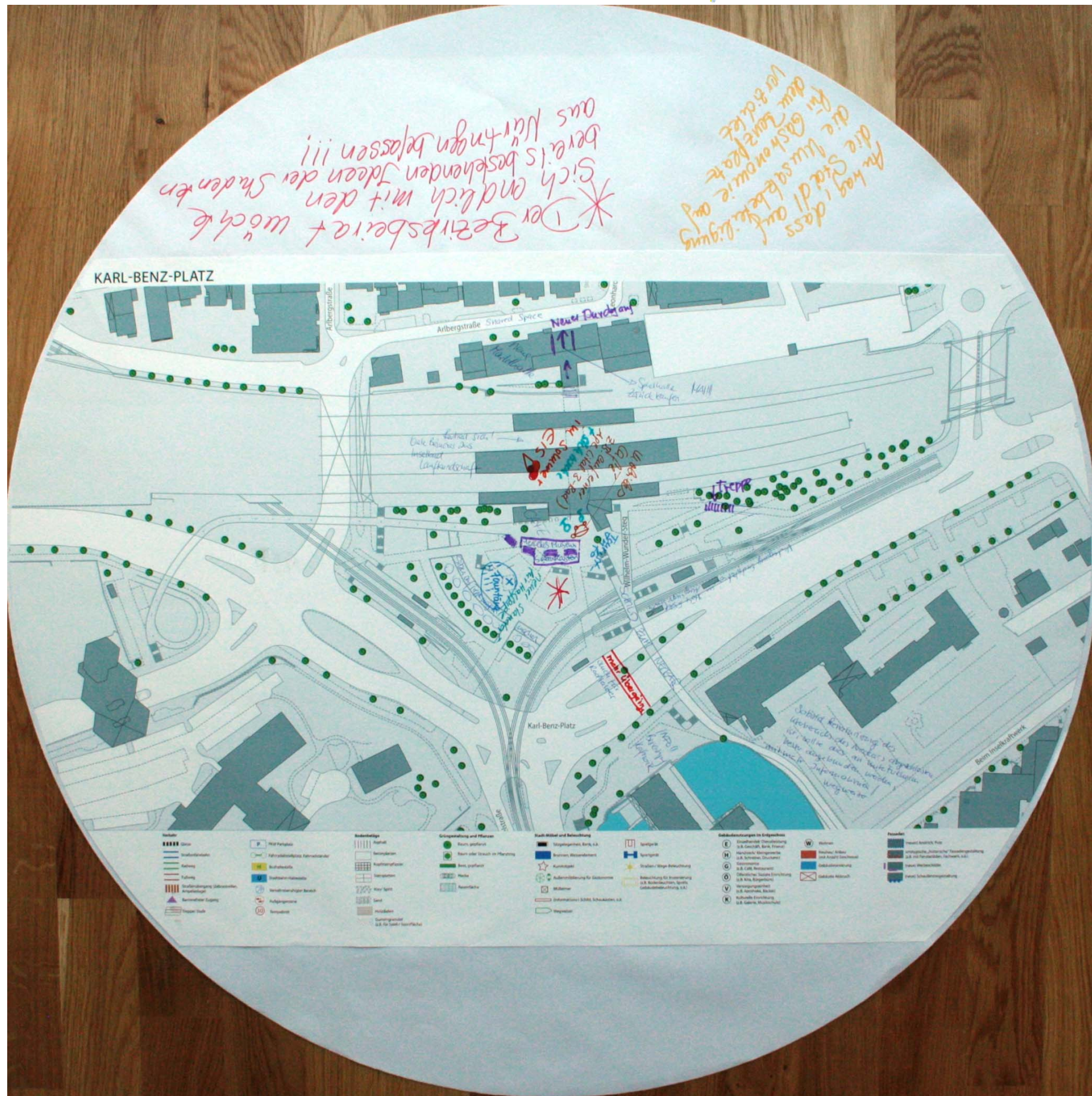
Detailplan zum Karl-Benz-Platz Nr. 3