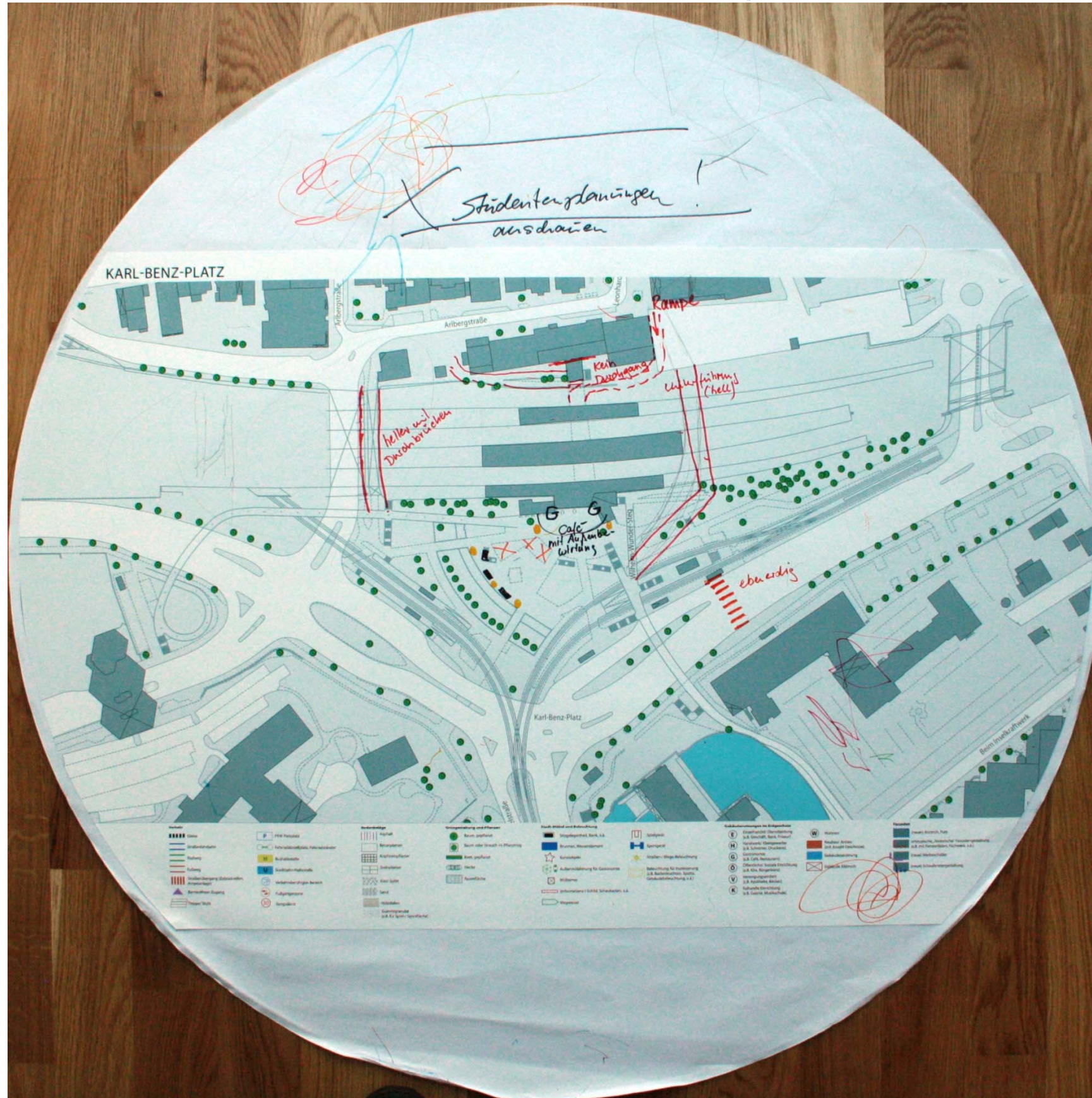
Detailplan zum Karl-Benz-Platz Nr. 1