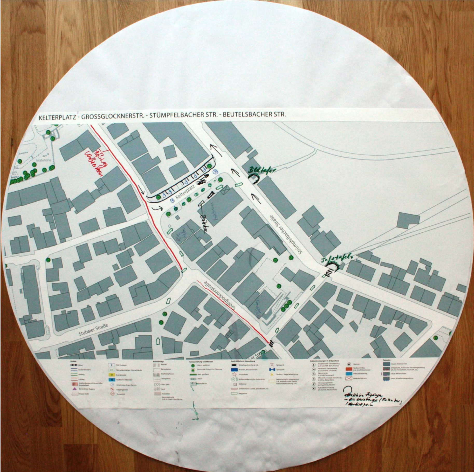
Detailplan zum Kelterplatz und der oberen Strümpfelbacher Str. Nr. 3