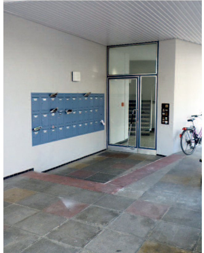
Die Belange der Mieter werden bei der Sanierung berücksichtigt.