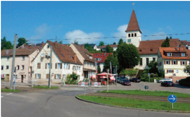
Kauffmannstraße im Westen des Gebiets