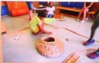
Essens-Waggon in der U-Bahn