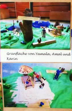
Grünfläche von Yamala, Amal und Karim