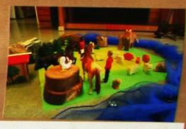
Jugendfarm „Mariem und Leticia“