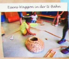
Essens-Waggon in der U-Bahn