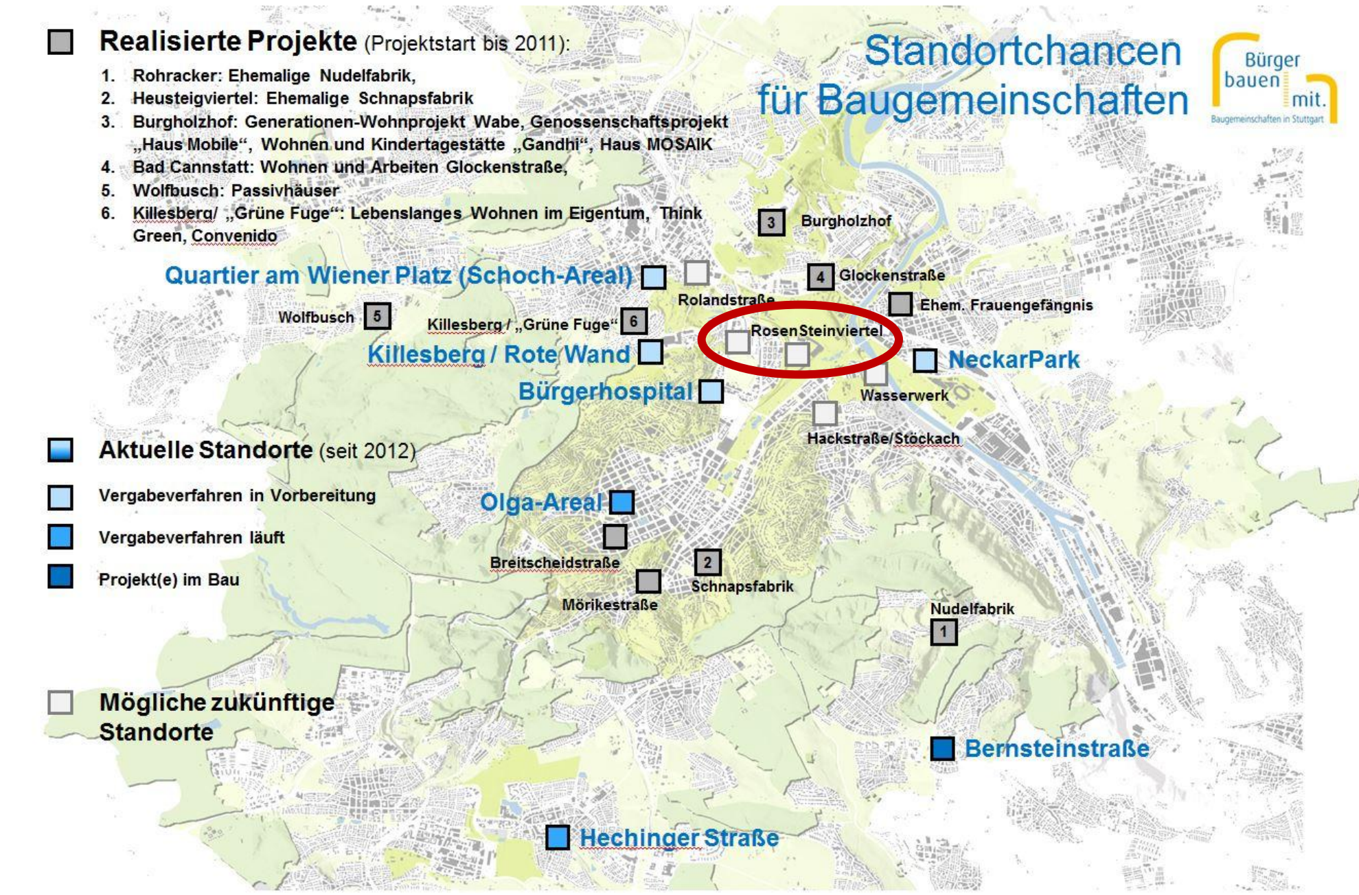
Baugemeinschaften in Stuttgart