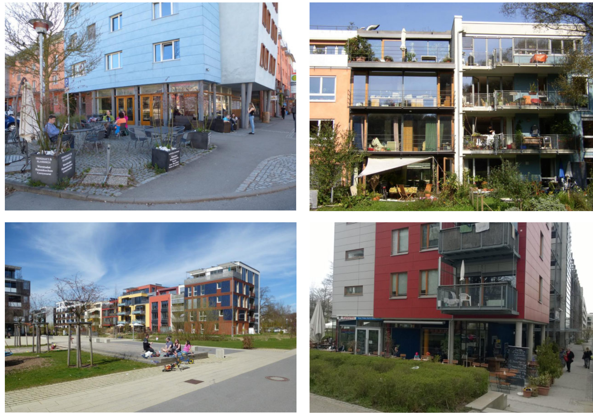
Urbane Vielfalt und Mischung