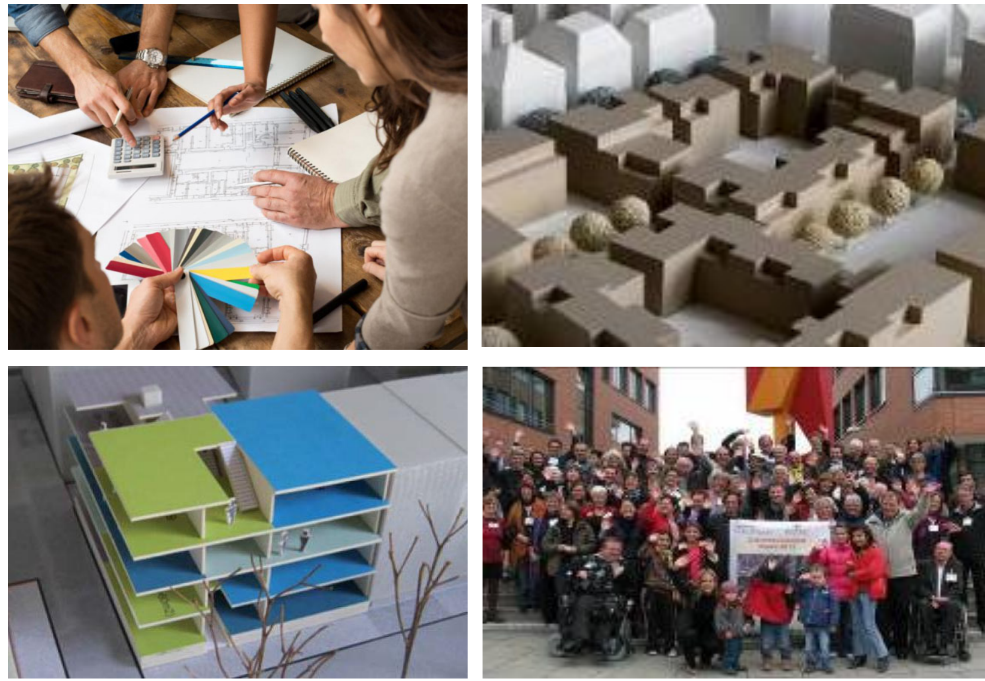
Gemeinsame Projektplanung und Engagement im Quartier